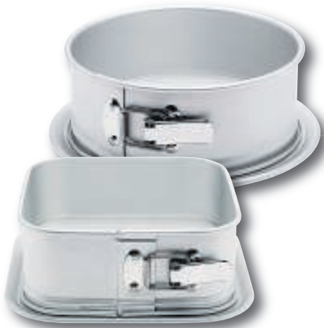
Extra hoge springvorm van Fat Daddio's vanaf €18,95