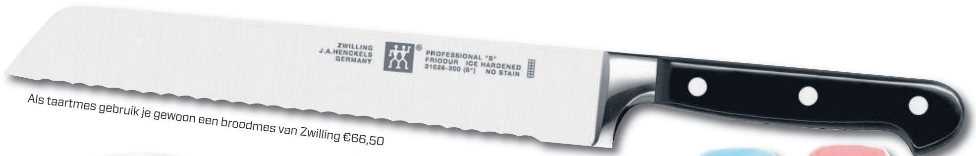
Als taartmes gebruik je gewoon een broodmes van Zwilling €66,50