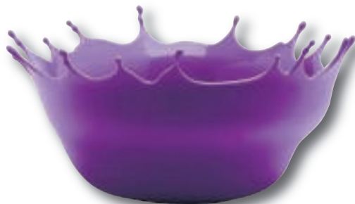
Siliconen-schaal van Menu vanaf €55