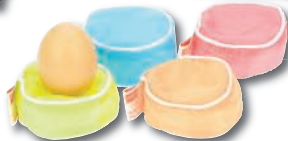
Vacuin Egg Pillow, 4 stuks €8,95