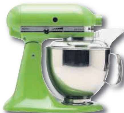
Mixer van KitchenAid (Artisan) vanaf €579